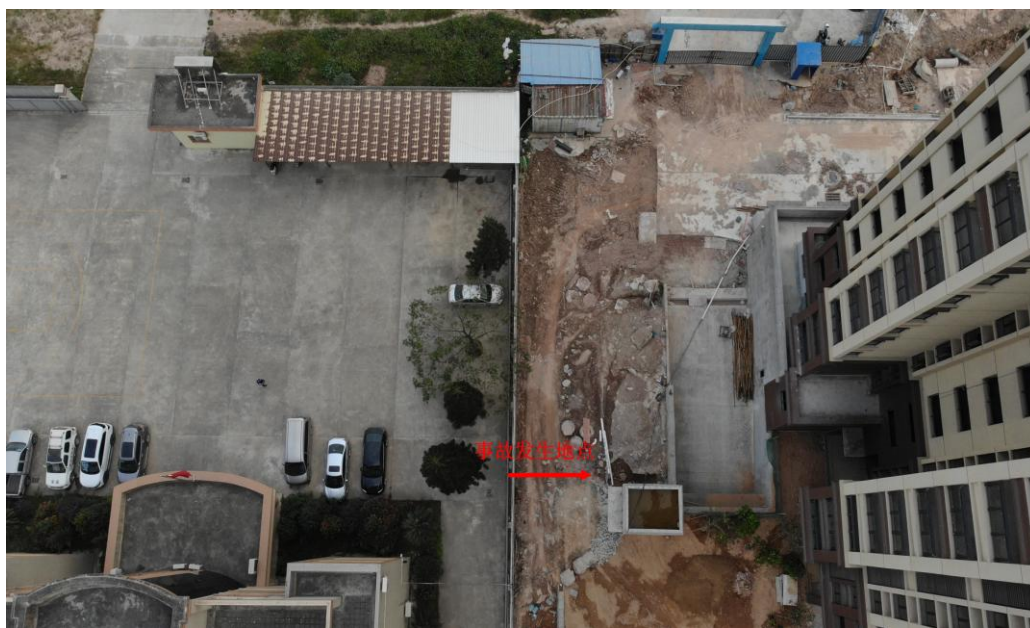
（图 1-事故发生地点航拍图）

事故现场位于恩平南国御园商品房建设项目 5 栋垃圾收集亭侧边的基槽。该基槽开挖深度约 1.8 米，宽度约 1.6 米，长度约 3.9 米。