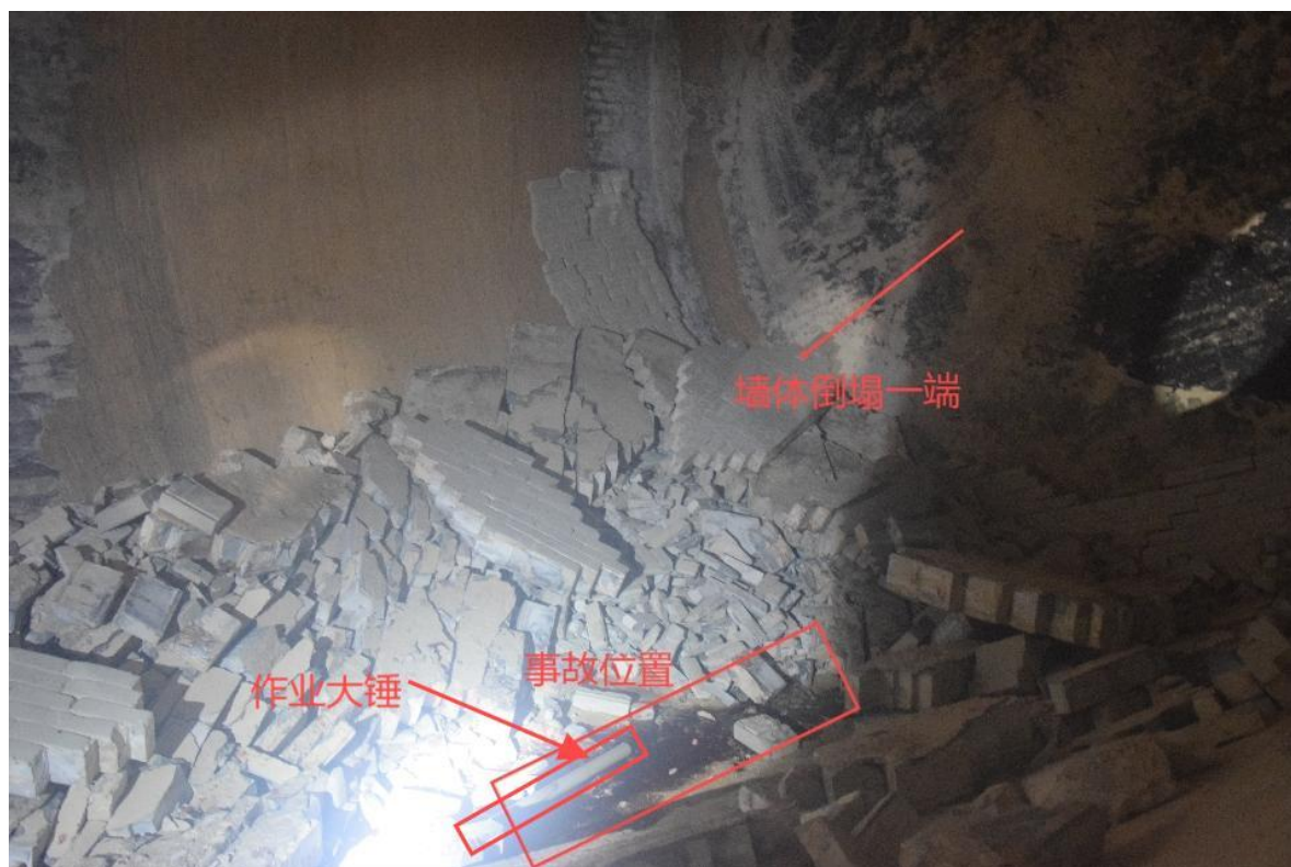
图三 球磨机内部（事故现场）