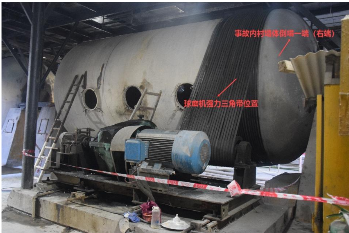
图一 事故球磨机外观